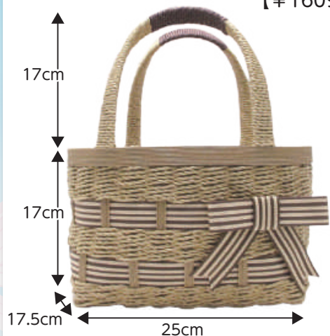
①ハードとループのリボンバッグ 【¥1609】