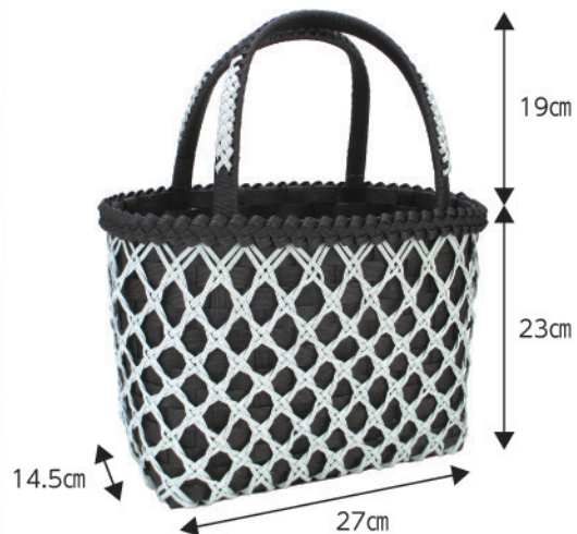
①違い四つ目のバッグ【税込¥1,650】