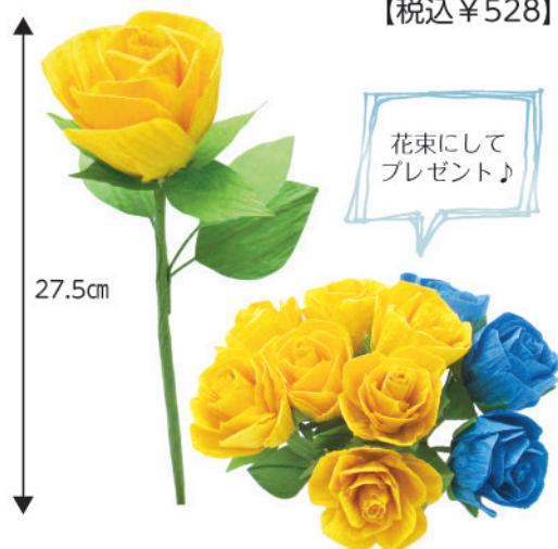
①ループのバラ(5本セット) 【税込¥528】