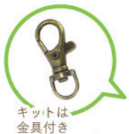
①まくらめ編みのストラップ (2個セット) 【税込¥495】