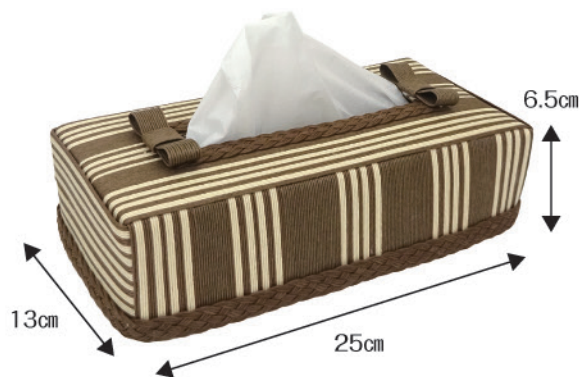
①貼り合わせティッシュケース 【税込¥990】