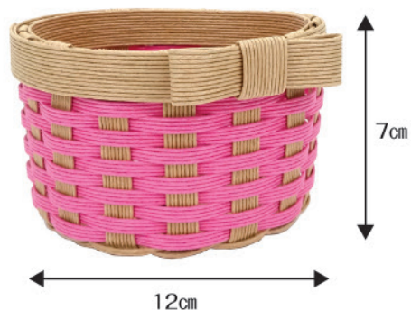
②追いかけて編みのミニかご 【税込¥605】